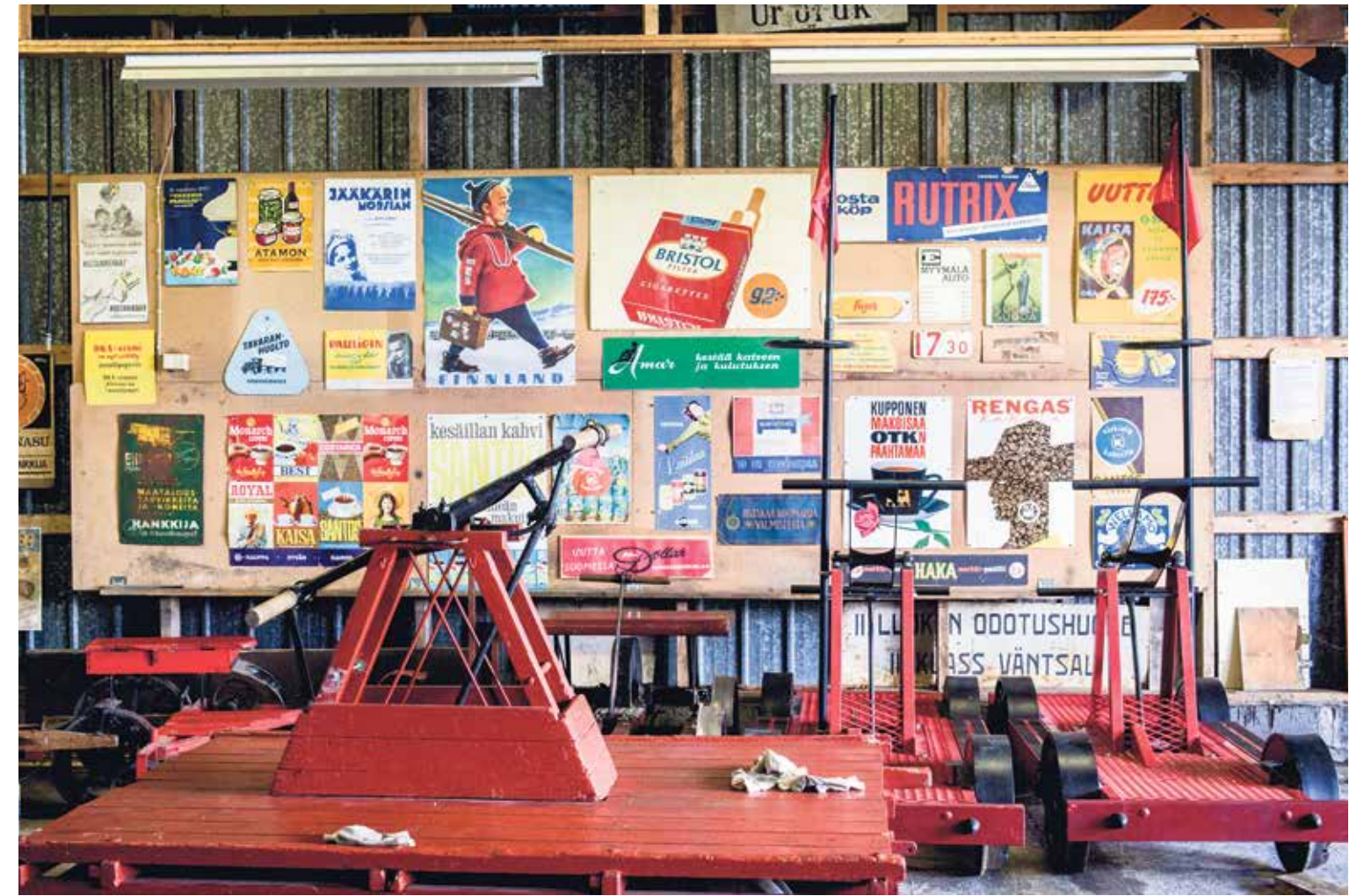
MINKIÖN ASEMA. Höyryveturien lisäksi veturihallissa voi ihastella resinoita ja poiketa ulkoilma-ajelulle.

HUMPPILAN ASEMALLE vievät kyltit ohjaavat kohti museorautatietä. Aseman toisella puolella on pienen pieni keltainen mökki, jonka eteen astuessaan huomaa saapuneensa todelliselle Harry Potterin Laituri 9 ¾:lle . Vanhat katulampit ja aseman soittokeho pitää-