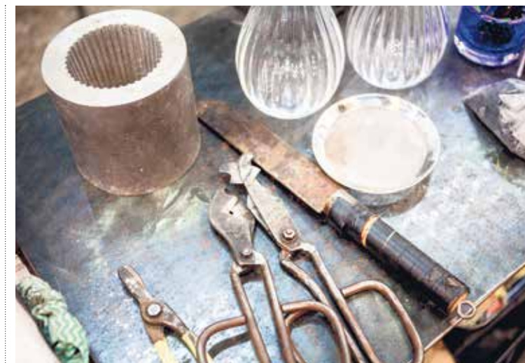
BIANCO BLU. Aloittelijakin pääsee muotoilemaan lasiveistoksia pihdeillä.

Humppilalainen lasinpuhallusperinne jatkuu koriste-esineistään tunnetussa Bianco Blussa, joka on